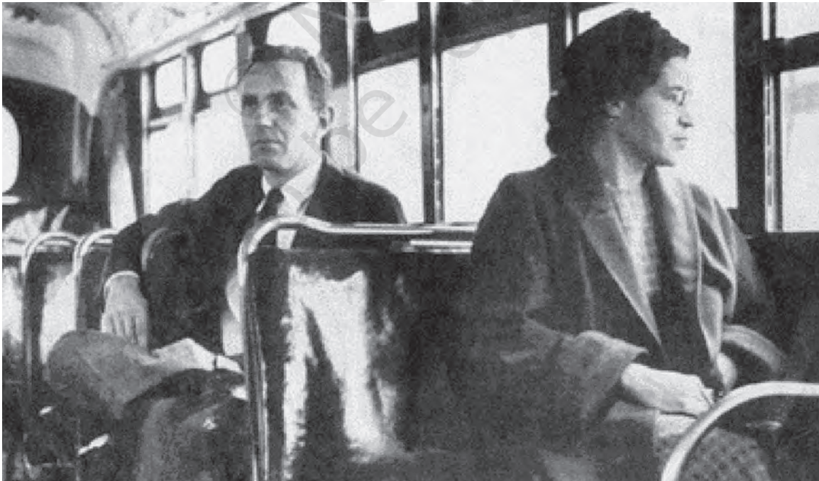
रोज़ा पार्क्स, एक अफ्रीकी-अमेरिकन औरत, जिनकी एक विद्रोही प्रतिक्रिया ने अमेरिकी इतिहास की दिशा बदल दी।

रोज़ा पार्क्स (1913–2005) एक अफ्रीकी-अमेरिकन महिला थीं। 1 दिसंबर 1955 को दिन भर काम करके थक जाने के बाद बस में उन्होंने अपनी सीट एक गोरे व्यक्ति को देने से मना कर दिया। उस दिन उनके इंकार से अफ्रीकी-अमेरिकनों के साथ असमानता को लेकर एक विशाल आंदोलन प्रारंभ हो गया, जो नागरिक अधिकार आंदोलन (सिविल राइट्स मूवमेंट) कहलाया। 1964 के नागरिक अधिकार अधिनियम ने नस्ल, धर्म और राष्ट्रीय मूल के आधार पर भेदभाव का निषेध कर दिया। इसने यह भी कहा कि अफ्रीकी-अमेरिकन बच्चों के लिए सब स्कूलों के दरवाज़े खोले जाएँ और उन्हें उन अलग स्कूलों में नहीं जाना पड़ेगा, जो विशेष रूप से केवल उन्हीं के लिए खोले गए थे। इतना होने के बावजूद भी अधिकांश अफ्रीकी-अमेरिकन गरीब हैं। अधिकतर अफ्रीकी-अमेरिकन बच्चे केवल ऐसे सरकारी स्कूलों में प्रवेश लेने की ही सामर्थ्य रखते हैं, जहाँ कम सुविधाएँ हैं और कम योग्यता वाले शिक्षक हैं; जबकि गोरे विद्यार्थी निजी स्कूलों में जाते हैं या उन क्षेत्रों में रहते हैं, जहाँ के सरकारी स्कूलों का स्तर निजी स्कूलों जैसा ही ऊँचा है।